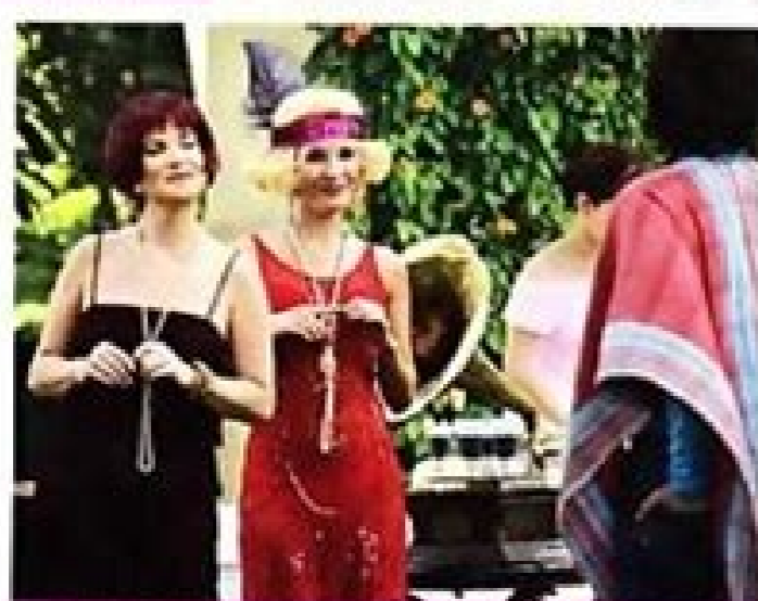
Silvana y Priscila organizan una fiesta en honor de Marcelo y se olvidan con un divertido detalle.

Minutos después, Lola la encuentra llorando y la mujer termina desahogándose: "Hace muchos años, Lorena y yo hicimos un viaje a Italia con nuestros esposos y es una medalla que me gustó mucho, pero que no me podía permitir. Ahora me doy cuenta de que ella la compró y la ha guardado toda este tiempo...". Dispuesta a firmar una tregua, Galeano decide enviar un precioso ramo de orquídeas a su vecina. Más tranquila, Regina vuelve a la fiesta, donde le espera una sorpresa menos agradable. Su hijo René, con la mejor intención, ha envuelto el radio que tiene como mascota para obsequiarlo como detalle, pero el